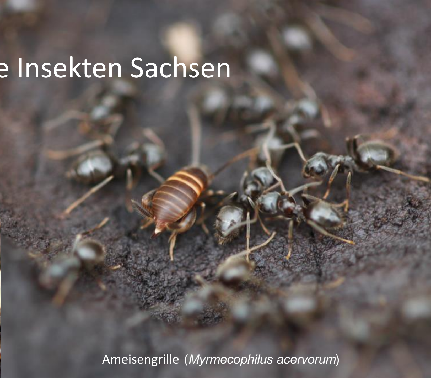
Ameisengrille ( Myrmecophilus acervorum )